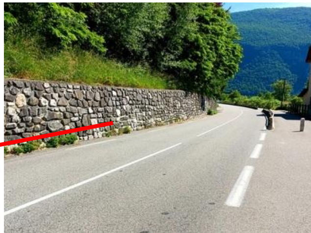
Entrée du village de lépin-le-lac élargissement de la route possible par un mur (identique à celui de St Alban)