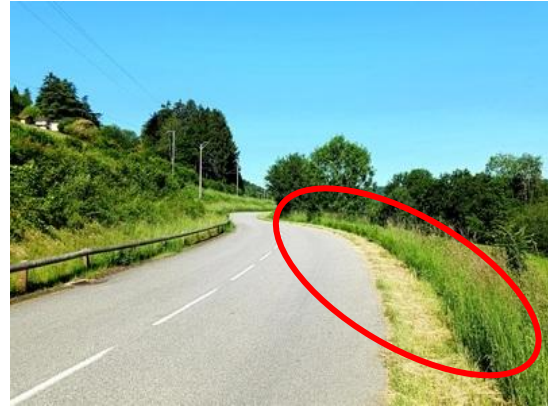
(D921d) à la sortie du chemin du Pomarin