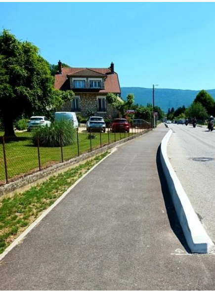
exemple de la piste possible à cet emplacement (Gué des planches)

insertion de la piste cyclable coté lac en élargissant de chaque coté la route actuelle