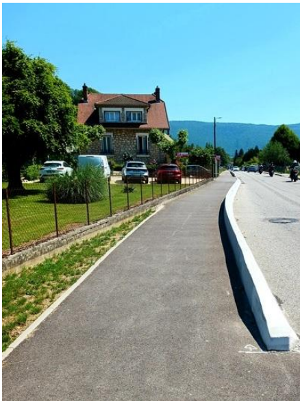
exemple de la piste possible à cet emplacement (Gué des planches)

insertion de la piste cyclable coté lac en élargissant de chaque coté la route actuelle