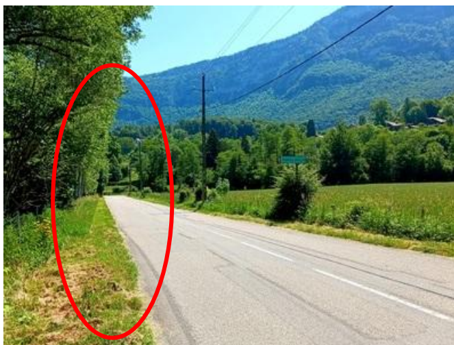
Possibilité de continuer la piste cyclable en élargissant la route à peu de frais