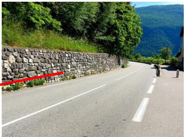
Entrée du village de lépin-le-lac élargissement de la route possible par un mur (identique à celui de St Alban)