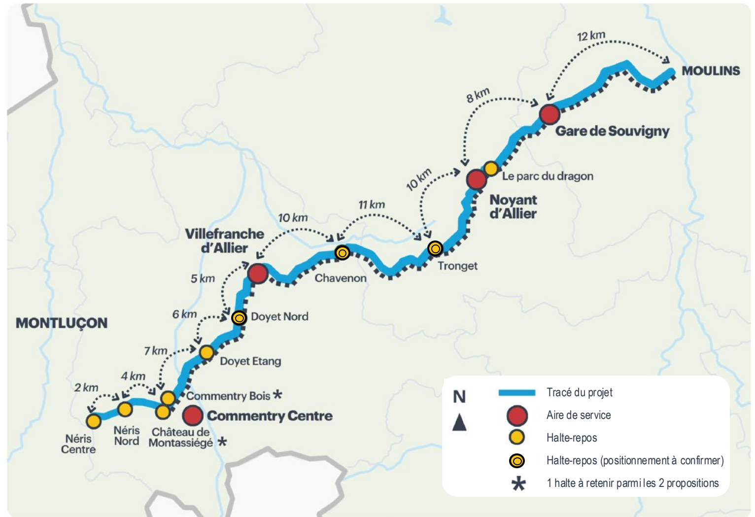
Equipement des aires de service