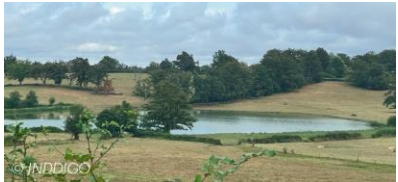
Bocage bourbonnais Etangs, panoramas...