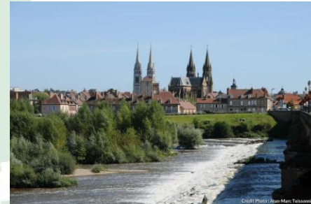
Patrimoine historique urbain