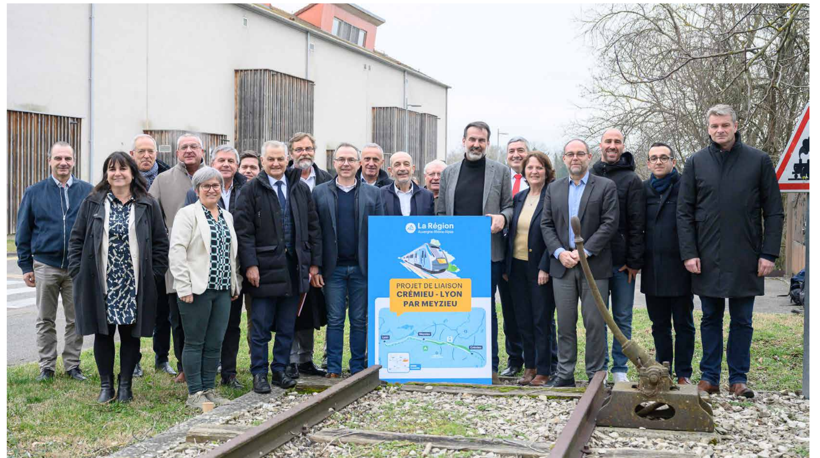
Comité de suivi de février 2025